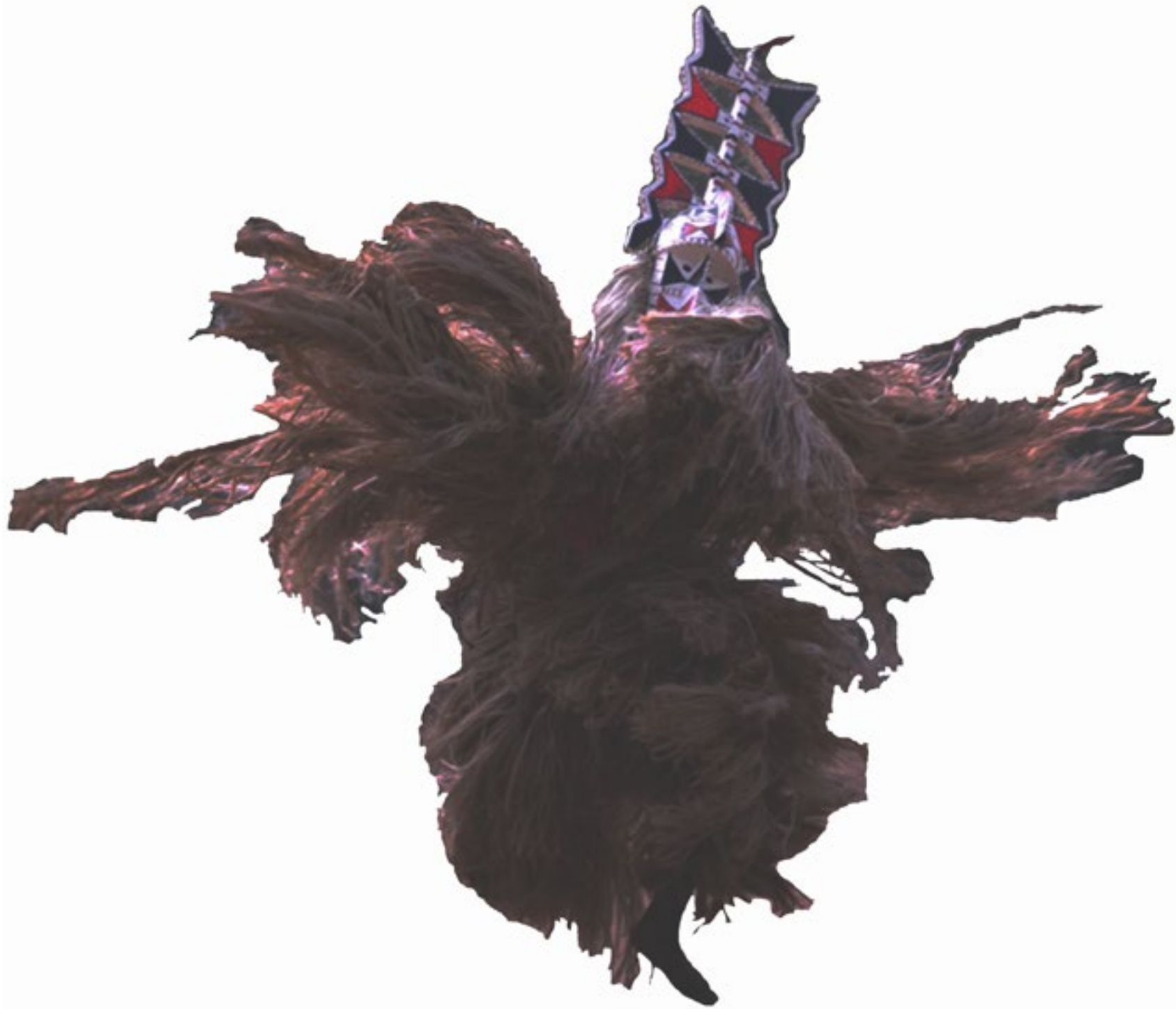
cheikh hamidou kane